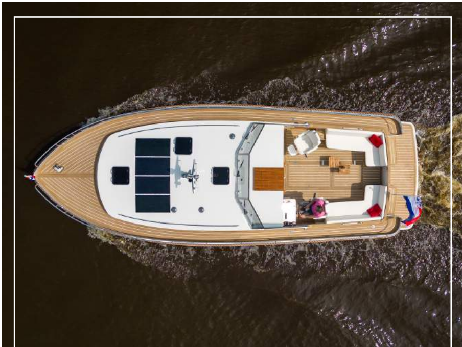
4 X TOUGH+ BLACK 121W FLUSH | Langenberg Cabin Cruiser 40 - Overwijk Yachting